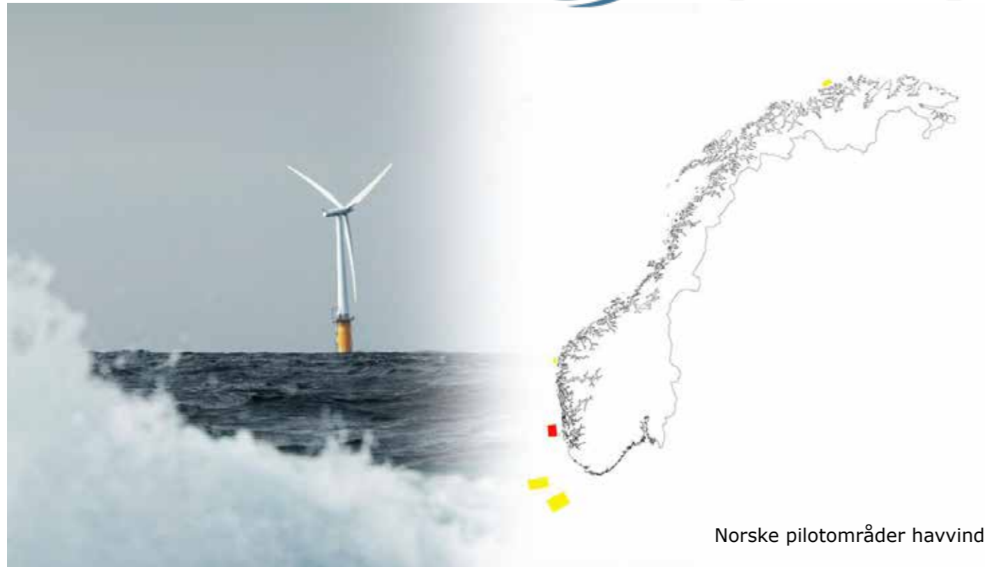
Norske pilotområder havvind