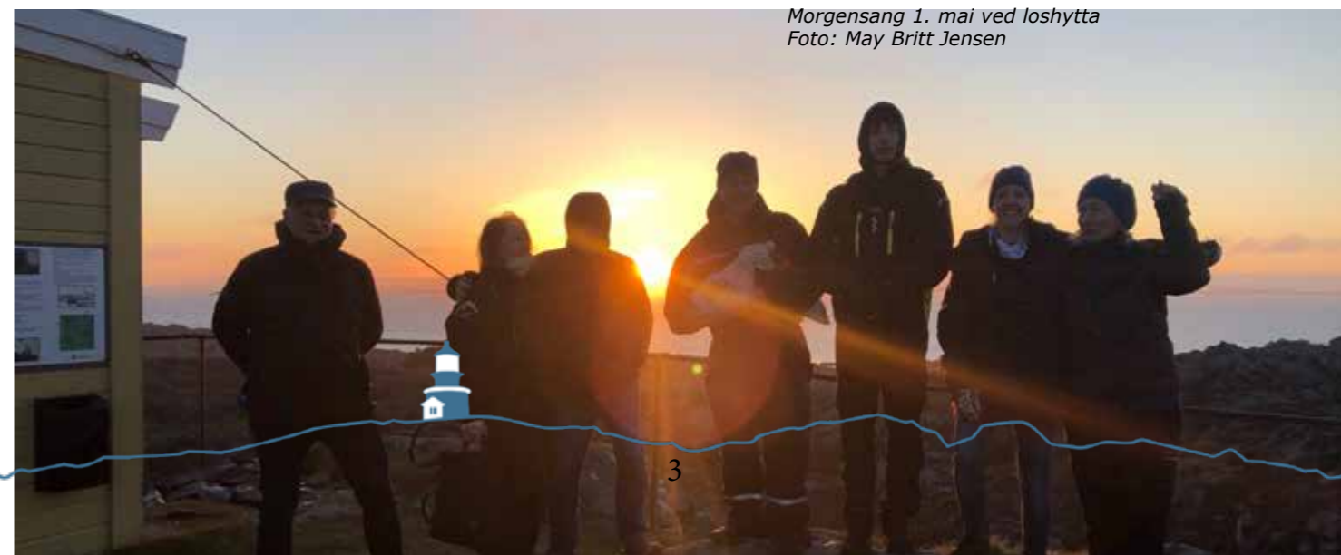
Morgensang 1. mai ved loshytta

Søndag 12. Juni Friluftsgudstjeneste Utsira Menighet markerer Vår Dag - frivillighetens år - Skaperverkets dag