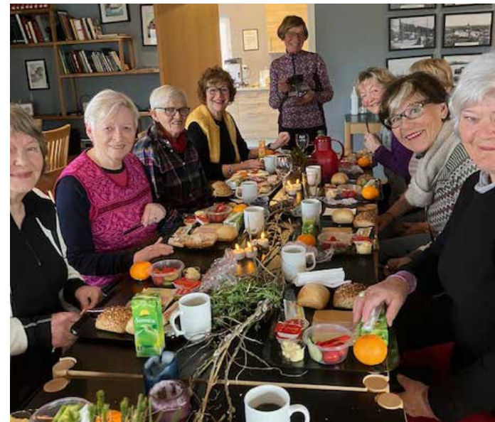
Frokost fra Joker. Anbefales.

Utsira har fått satt opp sin dagsturhytte, og vi som er aktive turgåere liker å oppsøke disse hyttene i ulike kommuner. Da vi hadde vår forrige fellestur til Utsira 18.august -22, fikk vi se helikopter i skytteltrafikk fra nord til sør med transport av bygg-elementene til hytta.