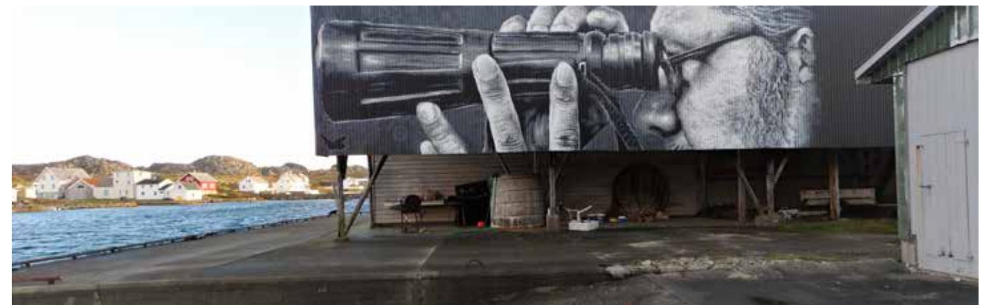
Et bevart Noheng i Nordrevågen.

Dette var det siste Nymånearrangementet dette halvåret. Velkommen tilbake til høsten!