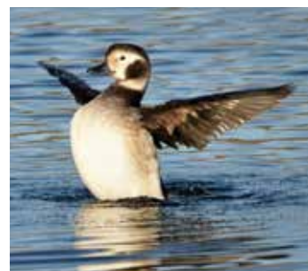
Havelle Clangula hyemalis

Det er ikke så mange i Norge som har møtt på en havert. Og det er ikke så rart - denne selarten er nemlig svært sky overfor mennesker, og holder seg ytterst på kysten og ute i havet. På Utsira er vi så heldige at vi kan se dette flotte pattedyret både fra land og når vi ferdes på sjøen.