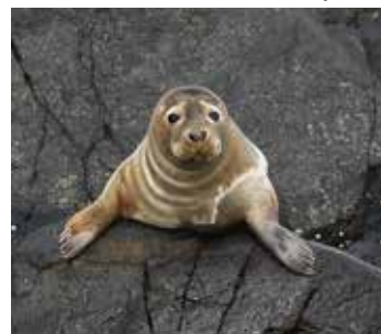
Havert Halichoerus grypus

I forrige Siralapp hadde vi en liten kviss med bilder av fire ulike arter som vi lurte på om dere visste navnet på. Her kommer fasiten.