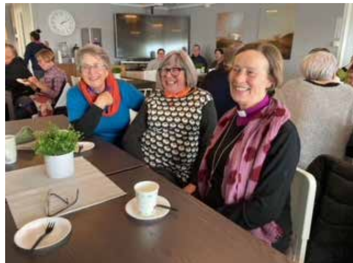
Takk for invitasjon. Kaffe og kake på bispevisitas.

Utsira har fått plassert sin hytte godt i terrenget med storslått og vid utsikt mot og passe nær havet. Inventaret er slik det bør være og med godt og variert lesestoff. Godstolen er på plass. Inngangspartiet fungerte særs bra for oss eldre damer, passe høyde på opptrinn og en stein å sitte på når turskoene skal snøres. Vi er litt betenkte med hensyn til fallhøyden fra gangarealet rundt