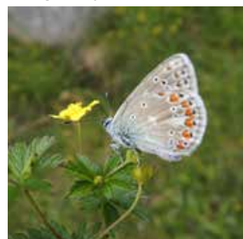
Tiriltungeblåvinge Polyommatus icarus som sitter på tepperot

Havelle er en ganske liten dykkand på ca. 0,5 – 1kg. Den har et avrundet hode og et relativt kort nebb. Den spiser hovedsakelig virvelløse dyr som muslinger, krepsdyr og ulike insektlarver. Den kan også ta fisk.