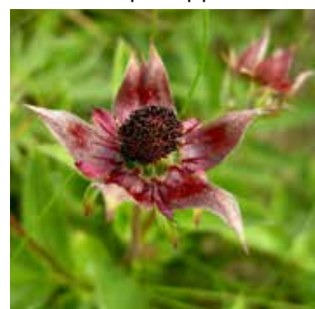
Myrhatt Comarum palustre

Tiriltungeblåvinge er en dagaktiv sommerfugl som finnes på gresskledder og blomsterrike enger. Arten foretrekker tørre lokaliteter, og finnes gjerne i veiskråninger og lignende. Sommerfugler legger egg som blir til larver. Etter larvestadiet forpupper den seg og blir til sommerfugl. Flygetiden til Tiriltungeblåvinge er fra mai til august.