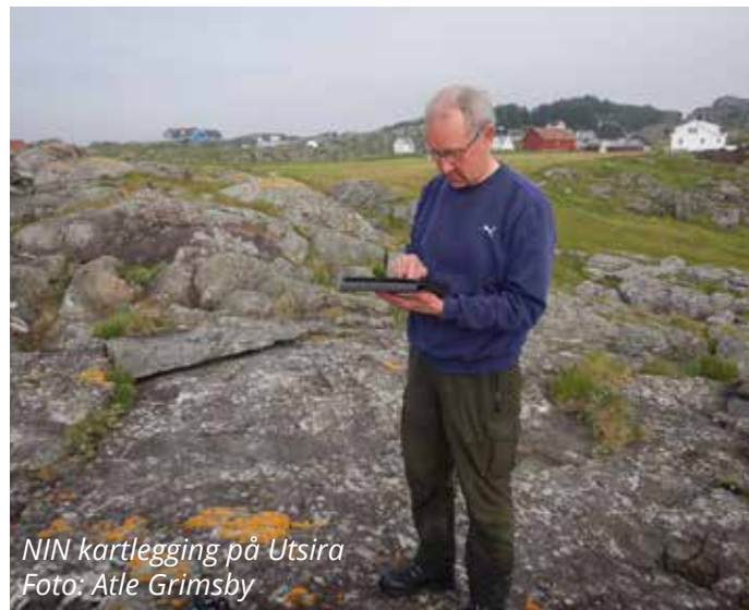
NIN kartlegging på Utsira