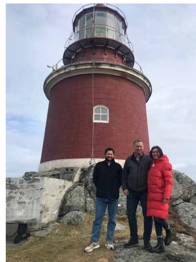
Siravind på Utsira