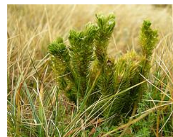
Lusegras – Northern Firmoss