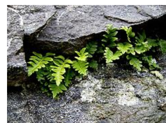
Sisselrot - Polypod