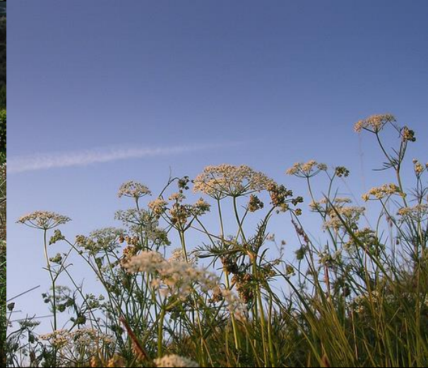
Strandnellik, Rød Jonsokblomst, Torvmyrull og Jordnøtt