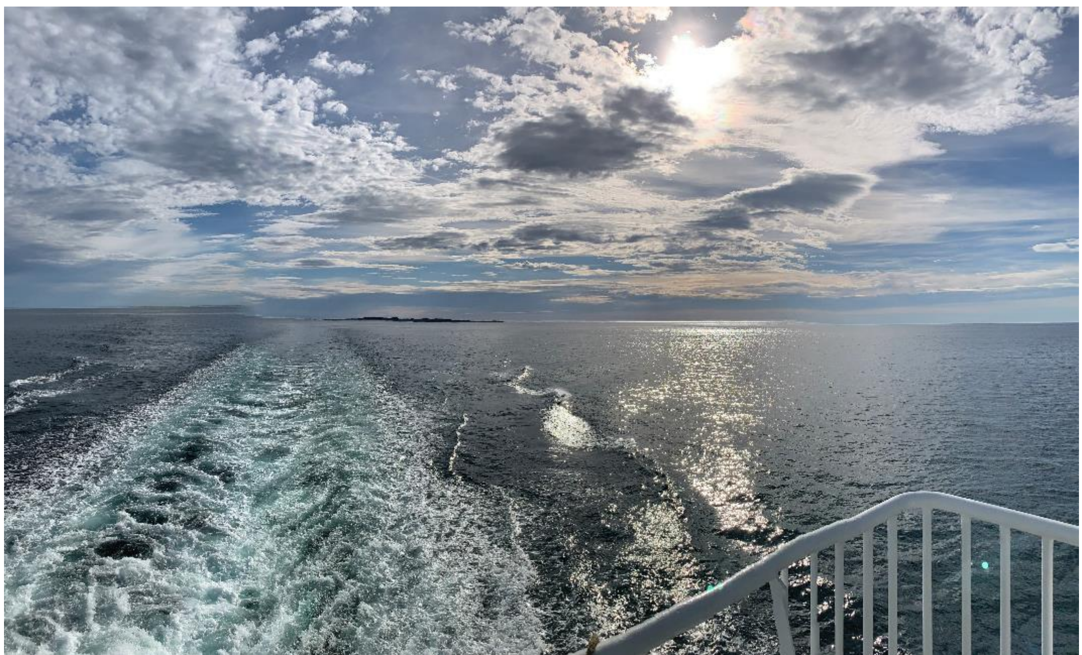
Sett fra østkanten...