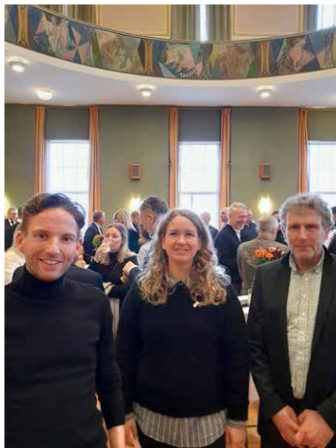
Kommunedirektør, Ordfører, og Ass. Kommunedirektør

Det var en fin dag hvor vi traff nye og gamle bekjentskaper.