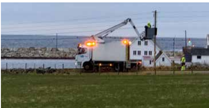
Fint i Fagne AS sin lift også når matrosen ligger. Tirsdag denne uka ble det lys!