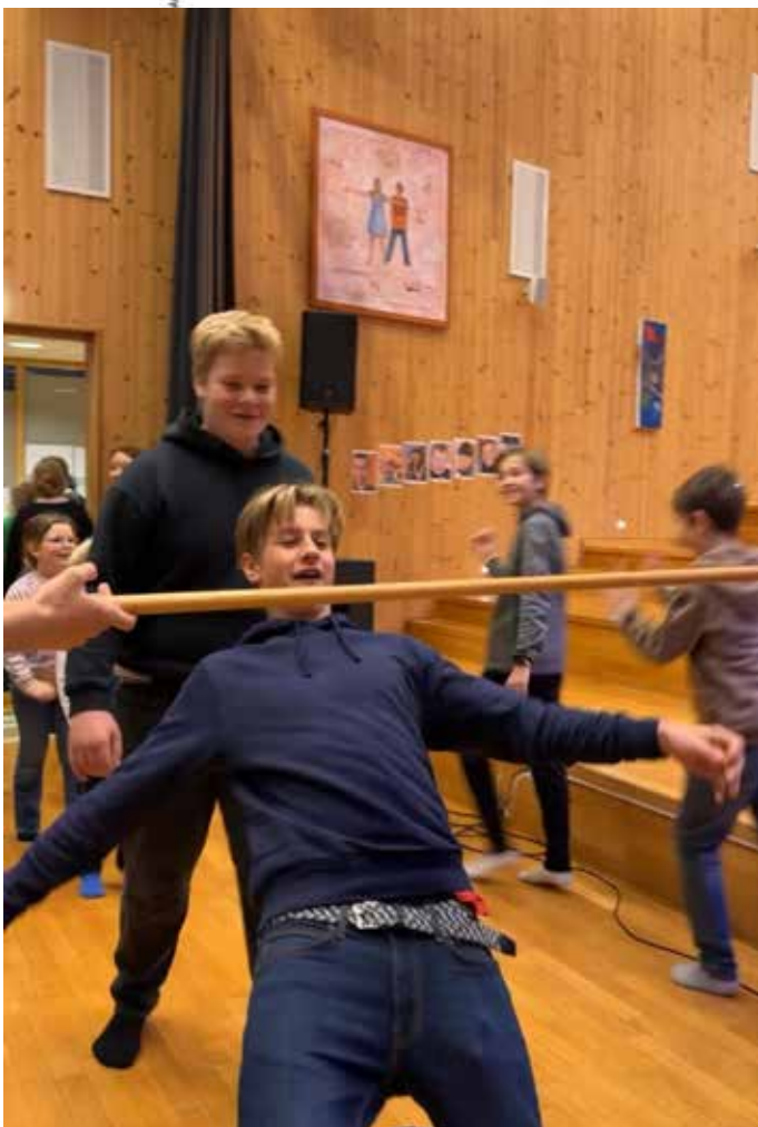
Limbo til julemusikk...