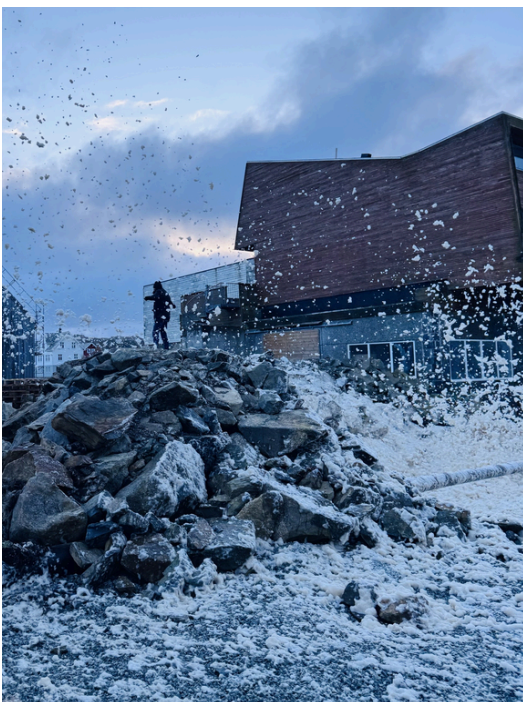
Skrau (skum) i Nordevågen!

Forrige uke har bydd på mange slags vintervær. Fra sterk nordavindskuling som pisket opp hele Nordevågen og sørget for skumparty på Bølgen, til barfrost, "winterwonderland", supersol, supermåne, storm og innstilt rutebåt. NrK Rogaland har snakket med både ordfører og skolen på radio- og TV-sendinger. Sjekk ut lenker til sakene på Utsira kommunes hjemmeside.