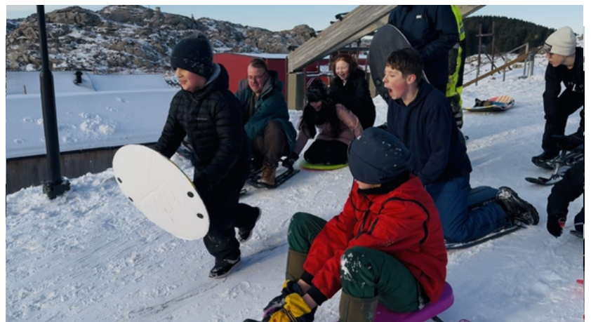
Skolens TV-stjerner på "Norge i dag" og Lokalen.

Skolen og barnehagen benyttet godværet til å arrangere snøaktivetsdag. Bygging og konstruksjon i snø, aking og flaskeløp/bob-bane var både lærerikt og gøy. De avsluttet dagen med et flott fellesmåltid i det fri; rykende varm lapskaus, flattbrød og saft.